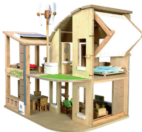
Figura 6: Casa de muñecas amueblada verde