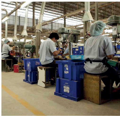
Figura 5: Producción manual de la casa de muñecas de Plan Toys

En la Figura 6 se muestra una casa de muñecas verde amueblada y terminada. La empresa goza de reconocimiento mundial por su fabricación sustentable y sus buenas prácticas.